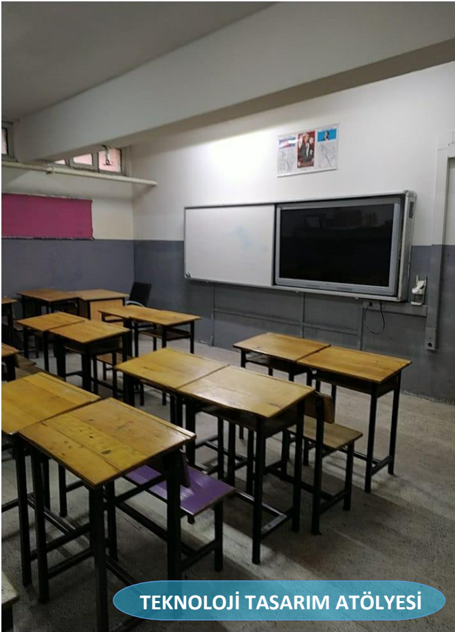
TEKNOLOJİ TASARIM ATÖLYESİ